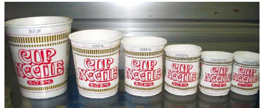
加圧前 1MPa 3MPa 10MPa 100MPa 490MPa